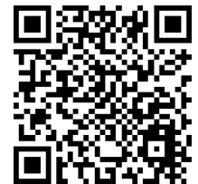
Information „Kamp-Lintforter Gärten“

Seit Jahren zeigen die Menschen der Stadt, wie ausgefallen, vielfältig und erholsam die Gärten in Kamp-Lintfort sind. Auch in diesem Jahr möchte die Projektgruppe „Kamp-Lintforter Gärten“ im Förderverein LaGa 2020 zeigen wie groß die gärtnerische Vielfalt ist. Ob nun im Dornröschenschlaf, als Refugium für Insekten und Vögel, zum Ackerbau in Selbstversorgung, oder einfach als persönlicher Lieblingssort ... der Rundgang durch die Gärten ist spannend und informativ für Jung und Alt.