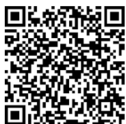
Installationsanleitung Flora Incognita